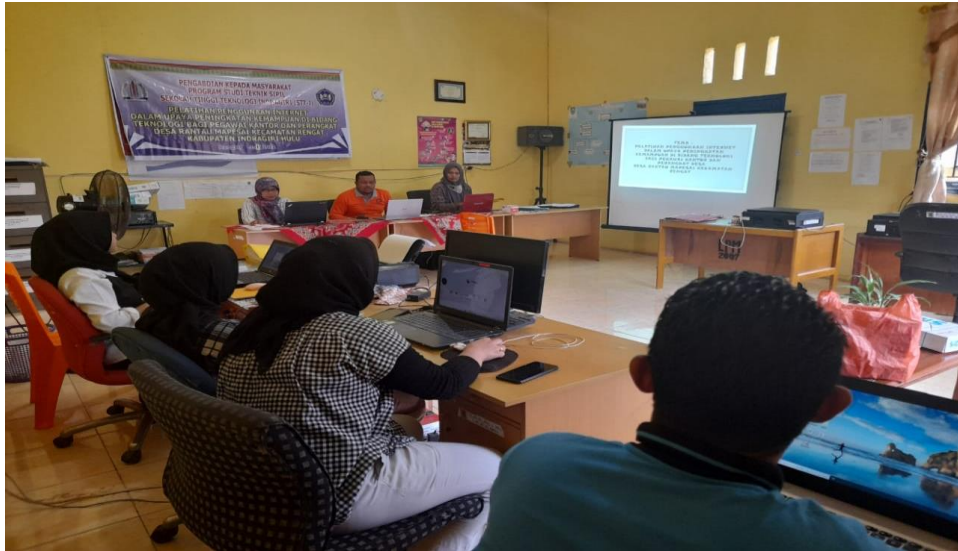
Gambar 1. Pelaksanaan Pengabdian Masyarakat

Adapun dokumentasi pelaksanaan pelatihan penggunaan fasilitas jaringan internet Browsing web, Email (Gmail) dan Geogle Drive sebagai berikut.