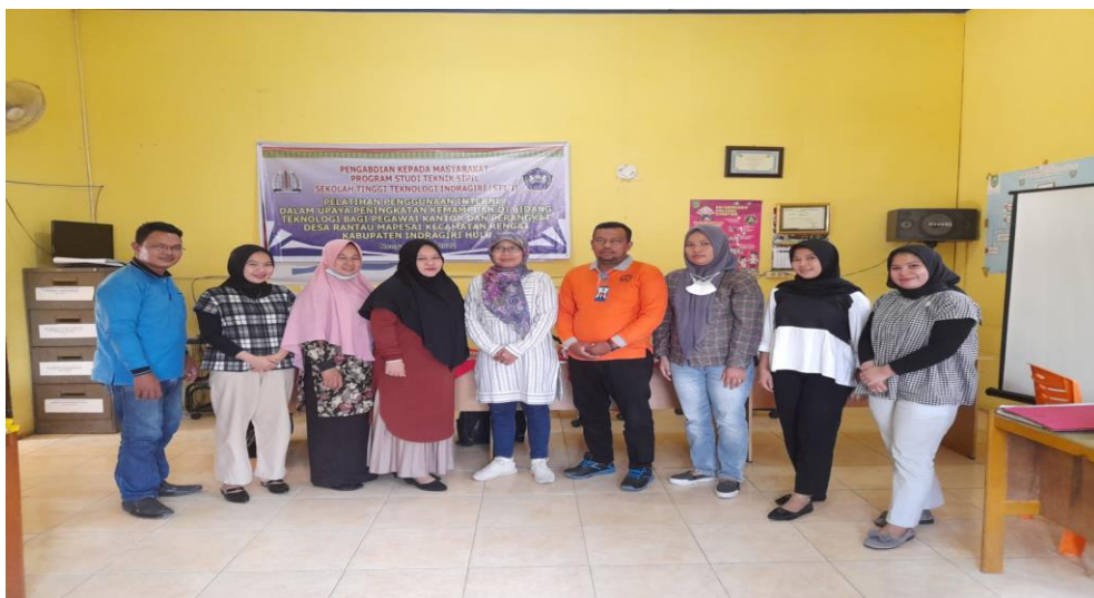
Gambar 2. Foto Bersama Sebagian Peserta Dan Tim Pelatihan

Gambar 1. Pelaksanaan pengabdian masyarakat dimana penjelasan salah satu tim dosen STT I dan di praktekkan secara langsung oleh pegawai kantor dan aparat desa Rantau Mepesai kabupaten Indragiri Hulu Propinsi Riau.