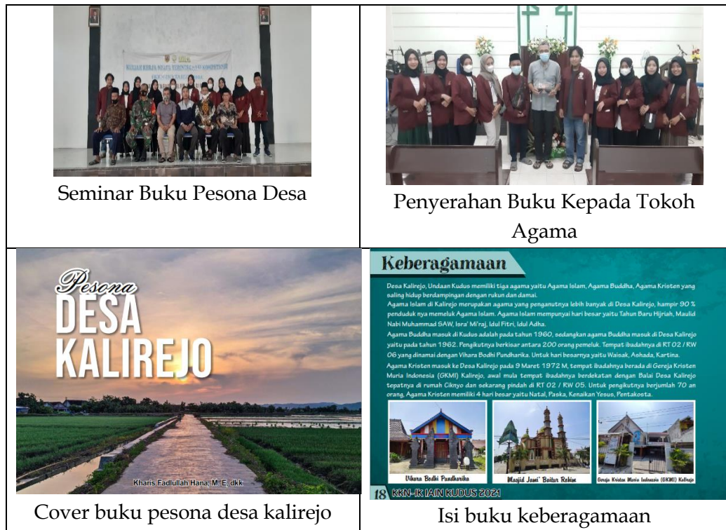
Seminar Buku Pesona Desa