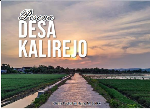
Cover buku pesona desa kalirejo