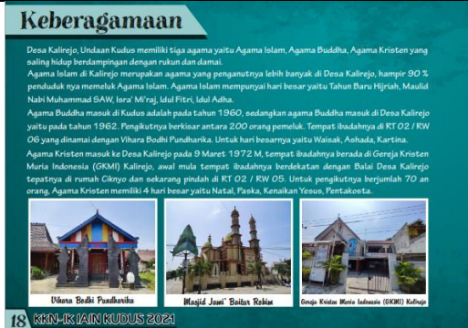
Isi buku keberagamaan