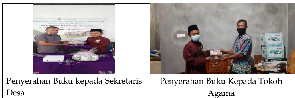
Penyerahan Buku kepada Sekretaris Desa

Dari hasil observasi, pengumpulan data, dan dokumentasi di beberapa objek kajian pengembangan potensi desa kalirejo maka dihasilkanlah Buku Pesona Desa Kalirejo oleh Tim PKM di Desa Kalirejo Undaan Kudus.