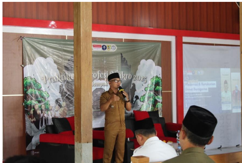
Gambar 1. Sambutan Kepala Desa

Kegiatan penyuluhan ini dimulai dengan menyusun rencana kegiatan, karena tema kami mengenai kerukunan umat beragama maka kami melakukan diskusi terkait pelaksanaan kepada warga setempat. Kami meminta banyak saran dan masukan dari warga, tokoh adat, tokoh masyarakat dan tokoh agama mengenai kegiatan penyuluhan yang kami lakukan. Dalam proses perencanaan ini juga kami mencari tahu sejauh mana kerukunan yang terjalin pada warga desa. Dengan banyak mengikuti kegiatan masyarakat seperti pengajian, tahlilan, dan kerja bakti kami dapat menilai bahwa warga setempat sangat kompak. Namun, meski begitu pengetahuan mengenai kerukunan umat beragama perlu kami sampaikan. Karena dengan memahami kerukunan umat beragama lebih dalam bisa terhindar dari perpecahan.