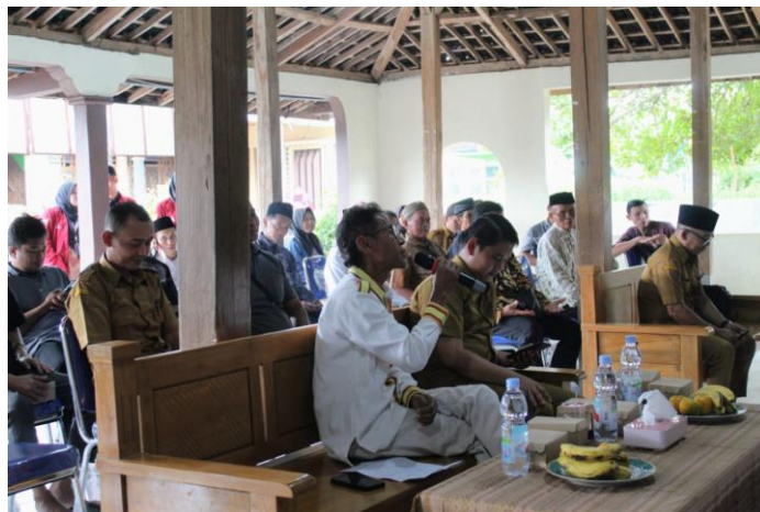
Gambar 3. Sesi Tanya Jawab

Audiens yang hadir sangat antusias dalam kegiatan ini, pada saat sesi tanya jawab banyak warga yang bertanya mengenai kerukunan umat beragama. Sesi tanya jawab ini menjadi hidup karena antara narasumber dan peserta penyuluhan ini sangat interaktif dalam membahas kerukunan umat beragama. Hal tersebut dapat dibuktikan pada gambar 3 terdapat audiens yang sedang bertanya pada narasumber. Dari hasil tanya jawab itu memiliki kesimpulan bahwa kerukunan adalah hal yang penting dalam bermasyarakat, dengan adanya kerukunan hidup bermasyarakat akan lebih tenang dan damai.