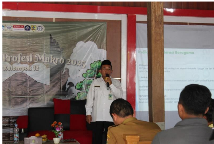
Gambar 2. Penyampaian Materi Mengenai Kerukunan Umat Beragama

Audiens yang hadir sangat antusias dalam kegiatan ini, pada saat sesi tanya jawab banyak warga yang bertanya mengenai kerukunan umat beragama. Sesi tanya jawab ini menjadi hidup karena antara narasumber dan peserta penyuluhan ini sangat interaktif dalam membahas kerukunan umat beragama. Hal tersebut dapat dibuktikan pada gambar 3 terdapat audiens yang sedang bertanya pada narasumber. Dari hasil tanya jawab itu memiliki kesimpulan bahwa kerukunan adalah hal yang penting dalam bermasyarakat, dengan adanya kerukunan hidup bermasyarakat akan lebih tenang dan damai.