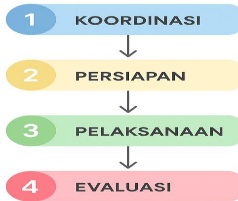
Gambar 1. Bagan Alir Metode Pelaksanaan PkM