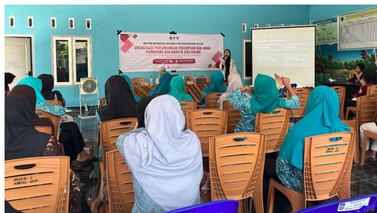
Gambar 5. Ceramah dan diskusi

Dalam pemaparan materi, Pemateri yang adalah tim dosen Ilmu Hukum juga menyampaikan penekanan tentang resiko yang muncul saat judi online telah menjadi bagian dari aktivitas lain yang dilakukan Masyarakat apalagi remaja. Diantara yang tersampaikan adalah potensi remaja dalam menghadapi risiko sosial seperti menurunnya kepercayaan keluarga, konflik dengan orang tua dan teman, serta isolasi sosial akibat rasa malu dan stigma masyarakat (Fatimah, 2020). Di sisi lain, dampak ekonomi dan psikologisnya juga sangat serius. Kecanduan judi membuat seseorang kehilangan uang secara terus-menerus, terlilit utang, dan bahkan mengorbankan kebutuhan penting seperti pendidikan dan makanan. Secara psikologis, mereka dapat mengalami stres, depresi, gangguan emosi, serta kehilangan fokus dalam kehidupan sehari-hari (Kuss, 2017).