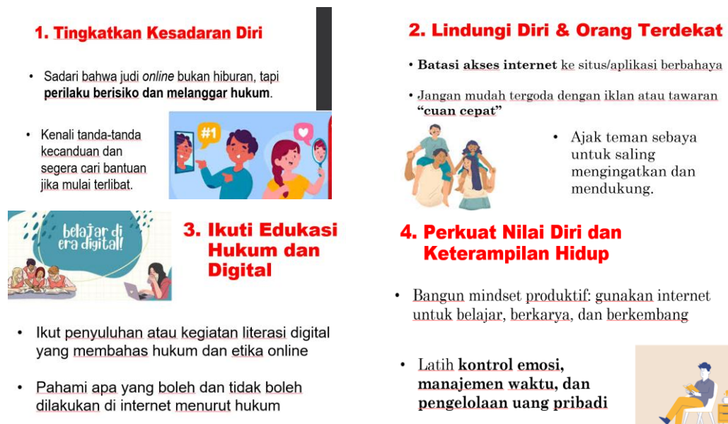
Gambar 6. Materi Penyuluhan Terkait

Setelah selesai pemateri menyampaikan materinya, peserta melakukan diskusi dengan metode tanya jawab yang menghasilkan peningkatan pengetahuan yang dilihat dari kemampuan peserta mengidentifikasi bentuk-bentuk judi online serta memahami risiko sosial dan psikologinya disamping adanya ancaman hukuman pidana. Tidak kalah penting, peserta juga akhirnya sadar bahwa pentingnya pengendalian diri dalam menggunakan teknologi dengan internetnya dan menggunakannya secara bijak. Pemberian materi ini menekankan bahwa literasi digital perlu ditanamkan sejak dini agar remaja tidak mudah tergiur oleh iklan atau tawaran “cuan cepat” dari situs judi online .