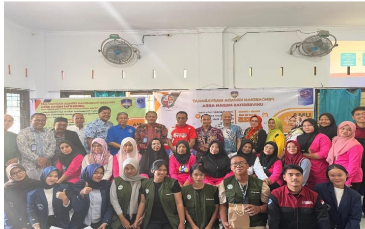
Gambar 6. Photo Bersama Kegiatan PKM Kolaborasi Di Desa Bandar Labuhan

Sebagai tindak lanjut, program ini membentuk kader lokal dan kelompok tugas yang berperan sebagai agen perubahan di masyarakat. Kader ini bertugas melanjutkan edukasi hukum dan ekonomi, serta menjadi rujukan bagi korban KDRT di lingkungan mereka. Dengan adanya monitoring dan evaluasi berkala, program dapat terus disesuaikan dengan kebutuhan masyarakat, memastikan keberlanjutan dan efektivitas upaya pencegahan KDRT di masa mendatang.