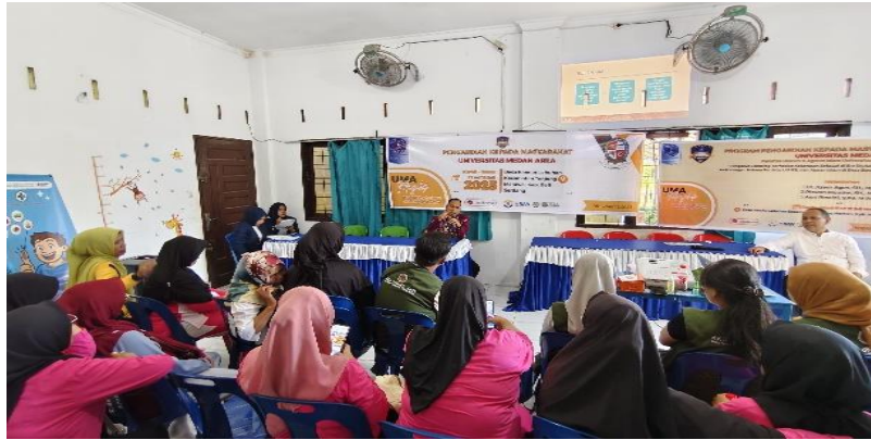
Gambar 5. Monitoring, Evaluasi, dan Tindak Lanjut

Monitoring kegiatan menunjukkan adanya peningkatan signifikan dalam pengetahuan hukum masyarakat terkait pencegahan dan penanganan KDRT. Melalui penyuluhan, ceramah, dan diskusi, peserta menjadi lebih memahami hak-hak hukum, prosedur pelaporan, serta pentingnya perlindungan bagi korban. Antusiasme peserta terlihat dari keaktifan dalam sesi tanya jawab dan permintaan untuk diadakan edukasi lanjutan, menandakan kebutuhan masyarakat akan pengetahuan hukum yang berkelanjutan.