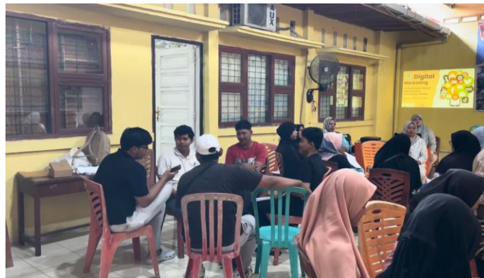
Gambar 6. Dokumentasi Praktek Pembuatan Media sosial

Output kegiatan pelatihan ini yaitu terbentuknya media sosial resmi (instagram) karang taruna sebagai media promosi usaha papan karangan bunga. Diharapkan media sosial ini menjadi wadah untuk memperluas jangkauan pasar dan meningkatkan visibilitas produk secara digital. Berikut contoh akun sosial media yang dibuat peserta: