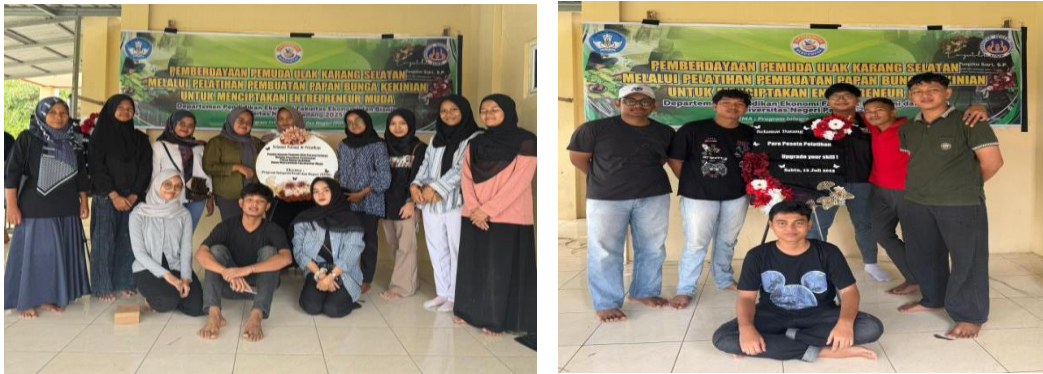
Gambar 4. Dokumentasi Kegiatan Praktek Pembuatan Papan Karangan Bunga Kekinian

Pelatihan Digital Marketing. Pelatihan ini dilakukan pada hari kedua, 13 Juli 2025. Pelatihan ini diberikan karena kurangnya pemahaman dan keterampilan peserta tentang digital marketing. Subarjo et al. (2023) menjelaskan wirausaha muda memiliki pemahaman yang kurang tentang teknologi digital dan kurangnya keterampilan dalam pemasaran digital. Pelatihan ini untuk membekali peserta dengan keterampilan memasarkan produk secara daring. Di era globalisasi, untuk survive wirausaha perlu melakukan digital marketing (Nuraisyah et al., 2023). Materi yang diberikan yaitu strategi pemasaran digital, pemanfaatan platform media sosial, dan branding produk dengan narasumber dosen Fakultas Ekonomi dan Bisnis Universitas Negeri Padang yaitu Dr. Armiaati, S.Pd, M.Pd. Dokumentasi kegiatan pelatihan sebagai berikut: