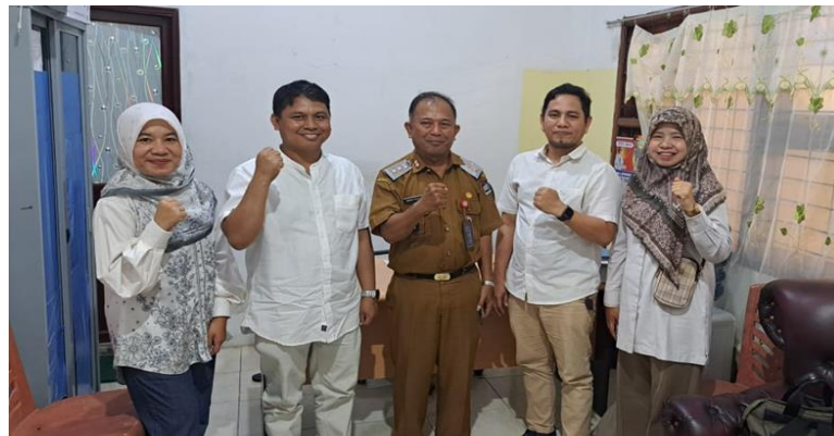
Gambar 1. Dokumentasi Pertemuan awal

Kegiatan persiapan berupa koordinasi dengan Lurah Ulak Karang Selatan dalam rangka penyamaan persepsi pelaksanaan kegiatan pengabdian, dilakukan tanggal 24 Februari 2025 di Kantor Lurah Ulak Karang Selatan. Berikut dokumentasi kegiatannya: