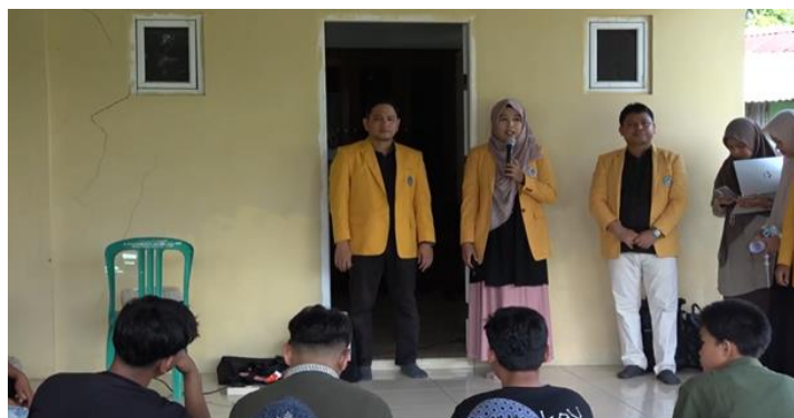
Gambar 2. Dokumentasi Pertemuan Penyamaan Persepsi

Dilaksanakan tanggal 7 Juli 2025 di Kantor Lurah Ulak Karang Selatan, dihadiri oleh Lurah Ulak Karang Selatan dan pemuda karang taruna sebagai mitra. Pada kegiatitan ini tim pengabdi berdiskusi dengan mitra tentang pelaksanaan kegiatan pengabdian meliputi bentuk kegiatan, waktu dan tempat kegiatan, dan lain-lain. Dokumentasi kegiatan sebagai berikut: