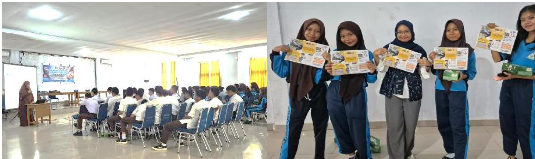
Gambar 2. Pemaparan materi dan penayangan video edukatif serta pembagian leaflet edukatif dan diskusi lanjutan bersama peserta.

Setelah sesi pemaparan dan diskusi, peserta menerima leaflet edukatif berisi ringkasan informasi mengenai jenis obat bebas, potensi penyalahgunaan, tips literasi digital, dan prinsip penggunaan obat yang benar. Leaflet ini dirancang sebagai media belajar mandiri dan sebagai panduan untuk membantu siswa memverifikasi informasi kesehatan yang beredar di media sosial. Antusiasme peserta juga terlihat saat pembagian cinderamata “Apotek Mini”, yakni kotak kecil berisi contoh obat bebas lengkap dengan indikasi serta aturan pakainya. Cinderamata ini diberikan kepada siswa paling aktif sebagai bentuk apresiasi sekaligus media pembelajaran langsung. Kehadiran “Apotek Mini” terbukti meningkatkan motivasi peserta sekaligus memperkuat pemahaman mereka mengenai cara penggunaan obat yang tepat.