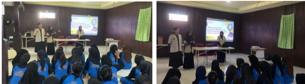
Gambar 1. Penyampaian materi dengan metode ceramah

Kegiatan promosi kesehatan terkait keamanan kosmetik dilakukan di SMK Kesehatan Samarinda dengan sasaran utamanya adalah siswa-siswi kelas 11 jurusan farmasi. Promosi kesehatan ini dilakukan dengan menggunakan metode ceramah yang disertai penggunaan media leaflet dan powerpoint sebagai media pembantu dalam penyampaian materi. Sebelum pemberian materi dilakukan pre-test terlebih dahulu untuk mengukur tingkat pengetahuan awal siswa-siswi terkait materi yang akan diberikan, setelah pengisian pretest selesai dilanjutkan pemberian materi kemudian dilakukan pengisian post-test untuk mengukur tingkat pengetahuan siswa-siswi terkait materi yang sudah disampaikan.