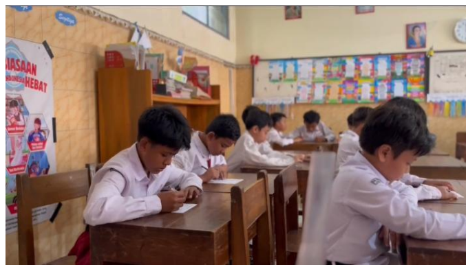
Gambar 3. Pelaksanaan pre-test

Kegiatan sosialisasi mengenai tindakan bullying dilaksanakan dengan sasaran siswa kelas VI yang berjumlah 27 peserta. Pelaksanaan kegiatan dimulai dengan sesi pembukaan dan perkenalan secara singkat untuk membangun suasana yang kondusif dan memastikan siswa merasa nyaman dalam mengikuti rangkaian kegiatan tersebut. Setelah itu, pendamping membagikan soal pre-tes kepada seluruh siswa sebagai upaya untuk mengukur tingkat pemahaman awal mereka mengenai bullying sebelum materi sosialisasi diberikan, sehingga hasilnya dapat dibandingkan dengan pemahaman mereka setelah kegiatan berlangsung. Instrumen pre-tes tersebut terdiri atas lima butir soal berbentuk multiple choice question (MCQ), di mana setiap soal menyediakan empat pilihan jawaban untuk dipilih oleh siswa. Melalui pre-tes ini, pendamping dapat memperoleh gambaran awal mengenai pengetahuan siswa dan menyesuaikan penyampaian materi agar lebih tepat sasaran.