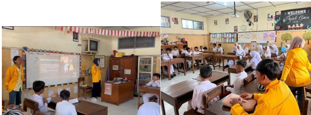
Gambar 4. Kegiatan penyampaian materi

dalam membangun lingkungan sekolah yang lebih aman, ramah, serta terbebas dari berbagai bentuk bullying (Istighfarin et al. 2024). Pendamping berupaya dalam menciptakan kedekatan dengan siswa melalui percakapan yang rileks dan diselingi candaan ringan, sehingga perhatian siswa bisa tetap focus selama mengikuti kegiatan. Materi yang diberikan meliputi pengetahuan dasar mengenai tindakan bullying, mulai dari pengertian, jenis jenis bullying, mengapa bullying tidak boleh dilakukan, hingga langkah pencegahan yang dapat dilakukan dalam kehidupan sehari-hari. Proses pembelajaran turut diperkuat dengan penggunaan media visual berupa presentasi bergambar, serta video kartun yang dirancang untuk membantu siswa memahami informasi dengan lebih mudah. Penggunaan kedua media ini tidak hanya mempermudah penyampaian konsep, tetapi juga mampu menarik perhatian siswa sehingga mereka lebih terlibat dan tertarik untuk mengikuti pembahasan topik yang diberikan. Media visual dan audiovisual tersebut membuat suasana belajar menjadi lebih hidup dan interaktif, sehingga materi dapat tersampaikan secara lebih efektif dan menyenangkan bagi siswa.