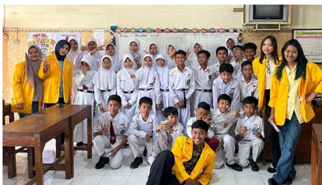
Gambar 1. Foto bersama anak kelas VI

Pada pengabdian ini, tim pengabdian melakukan sosialisasi mengenai pencegahan bullying di SD Negeri Kedungsari 3, Kecamatan Magelang Utara, Kota Magelang. Tujuannya yaitu untuk meningkatkan pemahaman siswa mengenai pencegahan bullying melalui pendekatan Pembelajaran yang interaktif, komunikatif, dan sesuai dengan karakteristik anak usia sekolah dasar. Harapannya Siswa mampu mengenali tanda tanda bullying, memahami dampaknya bagi korban maupun perilaku, serta menumbuhkan perilaku saling menghargai dalam kehidupan sehari-hari. Keberhasilan program ini sangat bergantung pada keterlibatan orang tua dan pihak sekolah sebagai pengawas sekaligus pembimbing yang berperan aktif dalam memantau perilaku siswa, memperkuat komunikasi, dan menindaklanjuti setiap potensi kasus bullying. Oleh karena itu, pengoptimalan kolaborasi antara siswa, guru, orang tua, dan manajemen sekolah menjadi langkah penting untuk memastikan bahwa upaya pencegahan bullying dapat berjalan secara berkelanjutan dan memberikan dampak nyata bagi terciptanya sekolah yang ramah anak.