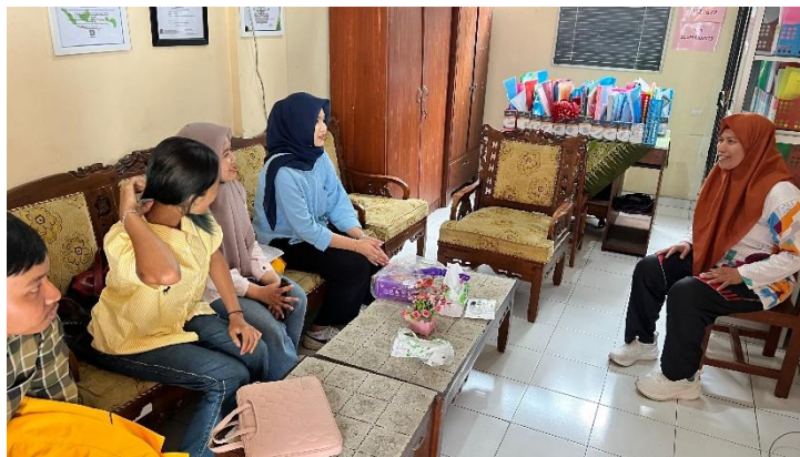
Gambar 2. Perizinan dan koordinasi kepada pihak sekolah

Pelaksanaan pengabdian dibagi menjadi tiga tahap, yaitu tahap persiapan, pelaksanaan, dan evaluasi. Pada tahap persiapan, dilakukan perizinan serta koordinasi dengan Kepala Sekolah dan guru untuk memperoleh dukungan. Tim juga menyusun materi sosialisasi yang dibuat menarik dan mudah dipahami oleh siswa Sekolah Dasar, dengan pendekatan visual dan dialogis. Media pendukung yang digunakan mencakup presentasi bergambar serta video animasi/kartun untuk mendorong siswa lebih mudah memahami topik yang dibahas. Selain itu, disiapkan juga pre-test dan post-test sederhana sebagai alat ukur untuk mengetahui tingkat pemahaman siswa.