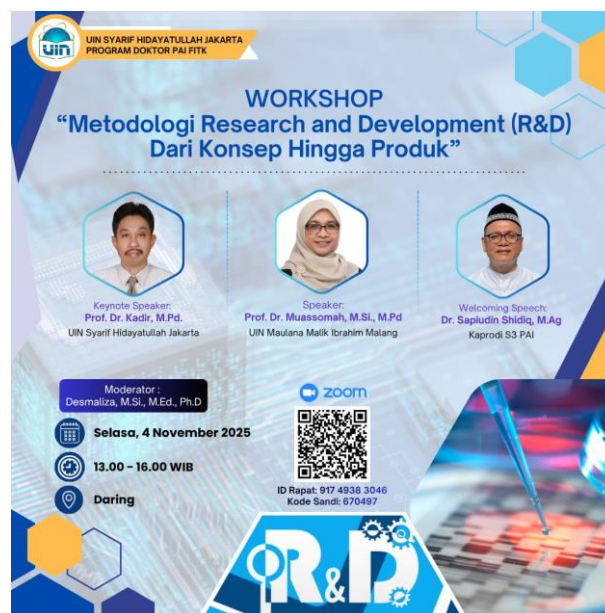
Gambar 1. Poster Kegiatan Workshop

Kegiatan Pengabdian kepada Masyarakat (PkM) ini dilaksanakan dalam bentuk workshop akademik yang dirancang menggunakan pendekatan partisipatif dan edukatif. Pendekatan ini dipilih karena sesuai dengan karakteristik peserta yang merupakan pembelajar dewasa ( adult learners ), sehingga proses kegiatan tidak hanya bersifat satu arah, tetapi mendorong keterlibatan aktif peserta dalam memahami dan mengaplikasikan metodologi Research and Development (R&D) dalam konteks Pendidikan Agama Islam.