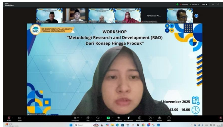
Gambar 2. Penulis sebagai MC pada Workshop

Hasil utama kegiatan menunjukkan adanya peningkatan yang signifikan dalam pemahaman konseptual peserta terhadap metodologi Research and Development (R&D). Sebelum mengikuti workshop, sebagian besar peserta mengungkapkan adanya kebingungan dalam membedakan penelitian R&D dengan jenis penelitian lain seperti penelitian eksperimen, penelitian tindakan kelas (PTK), maupun penelitian kualitatif deskriptif. Kondisi tersebut mengindikasikan masih lemahnya literasi metodologis dalam pemilihan desain penelitian yang tepat sesuai tujuan dan karakteristik riset. Temuan ini sejalan dengan berbagai studi mutakhir yang menyatakan bahwa kesalahan konseptual dalam memahami dan menerapkan desain penelitian, khususnya R&D, masih sering terjadi di kalangan mahasiswa pascasarjana dan dosen pemula, sehingga berdampak pada rendahnya kualitas metodologis dan luaran penelitian (Sugiyono, 2017).