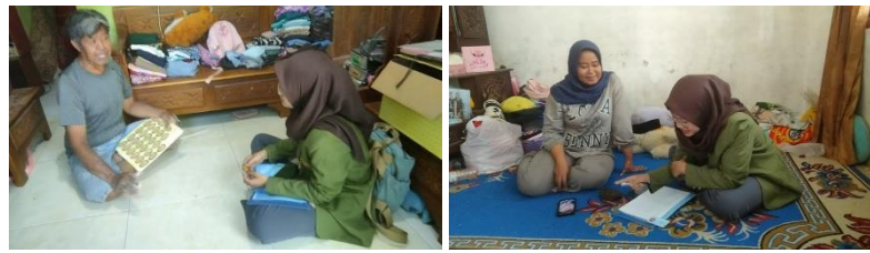
Gambar 2. Dokumentasi Survei UMKM dan Kepemilikan Legalitas Halal