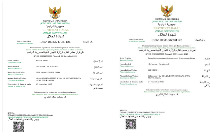
Gambar 5. Sertifikat Halal Terbit pelaku UMKM Kelurahan Sidosermo

Selama hampir empat bulan melakukan pendampingan, 23 pengajuan telah diterbitkan dan diterima oleh pelaku usaha. Selanjutnya adalah memberikan pemahaman mengenai perbedaan antara logo halal resmi yang diterbitkan oleh BPJPH dengan logo halal tidak resmi yang ada di internet. Perbedaan terletak pada pemberian nomor ID pada logo halal resmi, sedangkan pada logo halal tidak resmi tidak ada nomor ID sertifikat halal. Dengan demikian, kegiatan pengabdian ini membawa dampak positif bagi pelaku usaha untuk memenuhi kepatuhan legalitas usaha khususnya legalitas halal.