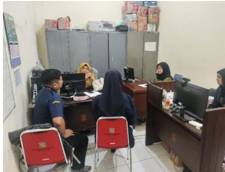
Gambar 1. Dokumentasi Perizinan di Kantor Kelurahan Sidosermo

Dinkopumdag Kota Surabaya melakukan pengenalan dan perizinan kepada pihak kelurahan untuk melakukan kegiatan pendampingan UMKM. Adapun kegiatan koordinasi ini bertujuan untuk menyelaraskan tujuan kegiatan pengabdian dengan program pembinaan UMKM yang telah berjalan di Tingkat pemerintah daerah. Kemudian mahasiswa magang tersebut mengidentifikasi data awal UMKM yang diberikan pihak kelurahan untuk didata ulang sesuai kriteria Program Sertifikasi Halal Gratis 2025 skema self-declare . Hasil dari tahap persiapan ini adalah dukungan dari pihak kelurahan terkait pelaksanaan kegiatan pengabdian masyarakat khususnya dalam meningkatkan kepatuhan legalitas halal bagi UMKM di Kelurahan Sidosermo.