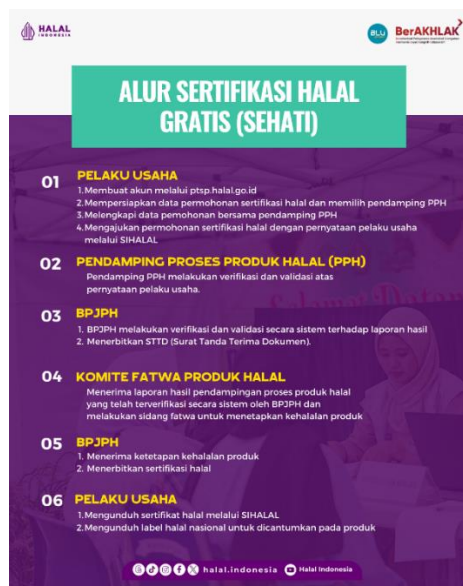
Gambar 3. Alur Sertifikasi Halal

Tahap selanjutnya yaitu melakukan pendampingan langsung dirumah masing-masing pelaku usaha. Sebelum dilakukan pendampingan, mahasiswa perlu memastikan kesiapan dokumen yang akan dipakai untuk mendaftarkan halal melalui Whatsapps , agar lebih cepat dan mudah prosesnya. Apabila semua dokumen sudah siap, mahasiswa bisa melakukan pendampingan sesuai jadwal yang ditentukan.