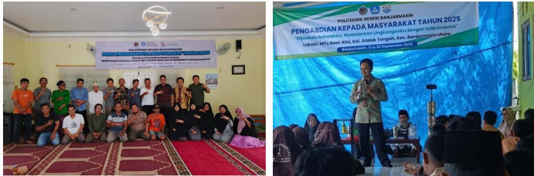
Gambar 2. Penyuluhan dan pelatihan pemilahan sampah

Berdasarkan hasil evaluasi kegiatan, tingkat pemahaman siswa MTs Noor Aini terhadap pentingnya pemilahan dan pengelolaan sampah mencapai 92,7%. Peserta tidak hanya memahami klasifikasi sampah organik dan anorganik, tetapi juga mulai menyadari dampak lingkungan dan kesehatan akibat pengelolaan sampah yang tidak tepat. Hasil ini sejalan dengan temuan Rezeki, et al (2024), yang menyatakan bahwa edukasi lingkungan dengan metode pembelajaran partisipatif dan praktik langsung lebih efektif dalam membentuk kesadaran dan perubahan perilaku masyarakat dalam pengelolaan sampah yang berkelanjutan.