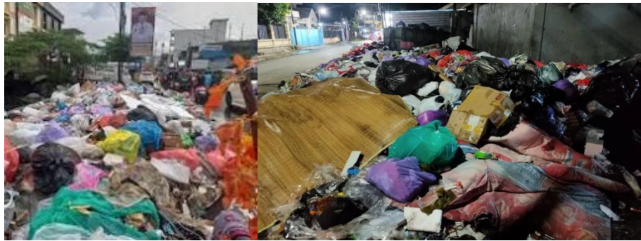
Gambar 1. Tumpukan sampah di Banjarmasin

Permasalahan sampah perkotaan menjadi isu krusial di berbagai kota besar di Indonesia, termasuk Kota Banjarmasin. Sebagai kota delta dengan karakteristik sungai yang kuat, Banjarmasin menghasilkan sekitar 600 ton sampah per hari. Penutupan Tempat Pembuangan Akhir (TPA) Basirih memperparah kondisi pengelolaan sampah dan menimbulkan status darurat sampah (Gambar 1). Dampaknya tidak hanya pada aspek lingkungan, tetapi juga kesehatan masyarakat dan kerugian ekonomi daerah.