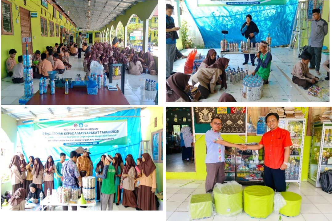
Gambar 3. Proses pembuatan eco-brick hingga menjadi sofa

menghasilkan produk bangunan fungsional dan estetik dari bahan daur ulang (Sudarman, Said, Nuryuningsih, & Syuaib, 2023). Teknologi ini juga mendukung ekonomi sirkular dengan memanfaatkan limbah menjadi sumber daya baru, serta dapat diintegrasikan dalam program pemberdayaan masyarakat untuk menciptakan lapangan kerja berbasis lingkungan yang berkelanjutan (Elfa & Djuniardi, 2024).