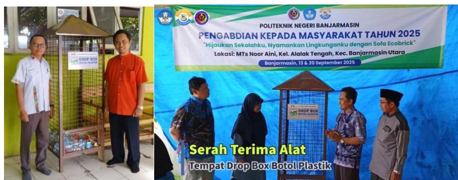
Gambar 4. Serah terima drop box limbah botol plastik

Penyediaan alat dan fasilitas pengolahan sampah menjadi faktor pendukung penting dalam keberhasilan program. Fasilitas yang disediakan meliputi alat pemotong plastik untuk eco-brick dan drop box untuk botol dan gelas plastik (Gambar 4). Keberadaan sarana ini mengatasi keterbatasan infrastruktur yang sebelumnya menjadi hambatan utama pengelolaan sampah di lingkungan mitra. Pemanfaatan fasilitas secara langsung oleh masyarakat dan sekolah mitra menunjukkan adanya pergeseran pola pengelolaan sampah dari sistem buang menjadi sistem pilah dan olah, sejalan dengan prinsip pengelolaan sampah berbasis sumber.