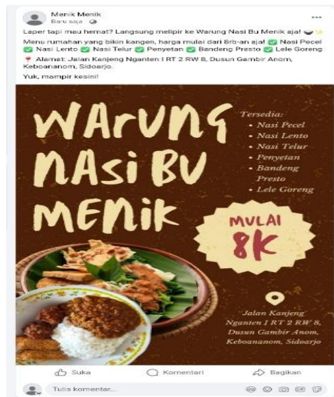
Gambar 2. Tampilan Konten Promosi Warung Nasi Bu Menik pada Facebook

Pemanfaatan media sosial Facebook memberikan ruang bagi UMKM untuk berinteraksi langsung dengan konsumen melalui kolom komentar maupun pesan pribadi. Interaksi tersebut dapat membantu membangun komunikasi dua arah antara pelaku usaha dan konsumen, sehingga meningkatkan kepercayaan serta ketertarikan konsumen terhadap usaha. Hasil ini sejalan dengan penelitian yang dilakukan oleh Wati (2025) yang menunjukkan bahwa penggunaan media sosial dapat meningkatkan kesadaran merek dan membantu UMKM dalam memperluas jangkauan pemasaran. Media sosial berperan penting dalam mendukung strategi pemasaran digital UMKM karena mampu menyampaikan informasi secara cepat, interaktif, dan berbiaya rendah.