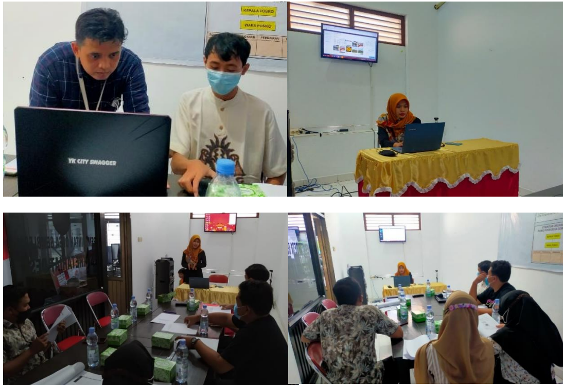
Gambar 2. Dokumentasi Kegiatan Webinar