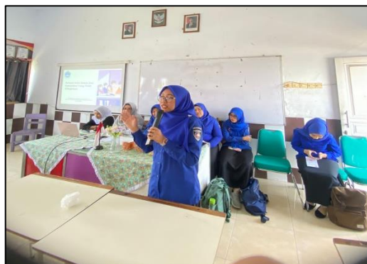
Gambar 2. Kegiatan Penyampaian Materi Melalui Pendekatan CSE

Tahap kedua adalah pelaksanaan yang dilakukan melalui penyuluhan dan diskusi interaktif yang difasilitasi oleh tim pengabdian. Metode CSE diterapkan dengan menekankan keterlibatan aktif peserta melalui diskusi kelompok, studi kasus, dan sesi tanya jawab, sehingga peserta dapat memahami bahaya perilaku seksual secara lebih mendalam dan kontekstual. Untuk mendukung proses edukasi, digunakan media pembelajaran berupa presentasi visual, leaflet, dan video edukasi yang dirancang sesuai dengan karakteristik remaja.