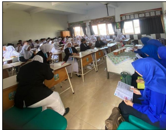
Gambar 3. Kegiatan Pengisian Evaluasi Post Test

Data yang sudah diperoleh dari hasil evaluasi, kemudian dianalisis secara deskriptif guna mendapatkan gambaran terkait peningkatan pengetahuan dan perubahan sikap remaja mengenai risiko seks bebas terkait kehamilan yang tidak diinginkan. Hasil analisis disajikan dalam bentuk persentase dan uraian naratif untuk memberikan gambaran capaian kegiatan pengabdian. Keberhasilan program ditunjukkan melalui peningkatan pengetahuan dan perubahan sikap remaja ke arah yang lebih positif dalam pencegahan perilaku seks bebas.