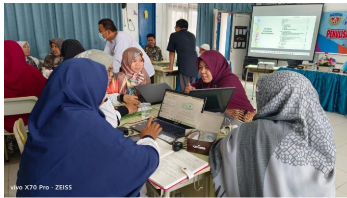
Gambar 2: Pendampingan Penulisan Karya Ilmiah (1)