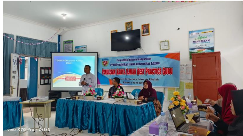
Gambar 1: Pemamaparan Materi terkait Penulisan Karya Ilmiah oleh Tim

Materi yang disampaikan diantaranya berkaitan dengan karakteristik karya ilmiah yaitu: mengacu pada teori sebagai landasan berpikir, lugas (tidak emosional dan tidak menimbulkan banyak interpretasi), logis (disusun dengan urutan yang konsisten), efektif, dan efisien (Raco, 2018). Selanjutnya tim membahas Langkah-langkah penulisan karya ilmiah, yaitu: diawali dengan menentukan topik, merumuskan tujuan pembahasan, dilanjutkan dengan mengumpulkan referensi, kemudian membuat kerangka tulisan, dan diakhiri dengan menyusun kerangka tulisan yang utuh dan lengkap (Muhammad Farkhan, 2006). Selain itu, Tim juga menyampaikan materi terkait sistematika penulisan karya ilmiah, jenis karya ilmiah, dan memperlihatkan contoh karya ilmiah yang baik.