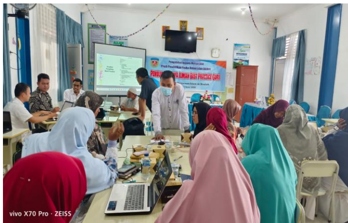
Gambar 3: Pendampingan Penulisan Karya Ilmiah(2)

Dalam pendampingan penulisan karya ilmiah ini, peserta dibagi ke dalam 3 (tiga) kelompok. Setiap kelompok didampingi oleh 2 (dua) orang tim PkM Universitas Adzkie. Luaran pendampingan ini adalah draft karya ilmiah oleh masing-masing kelompok.