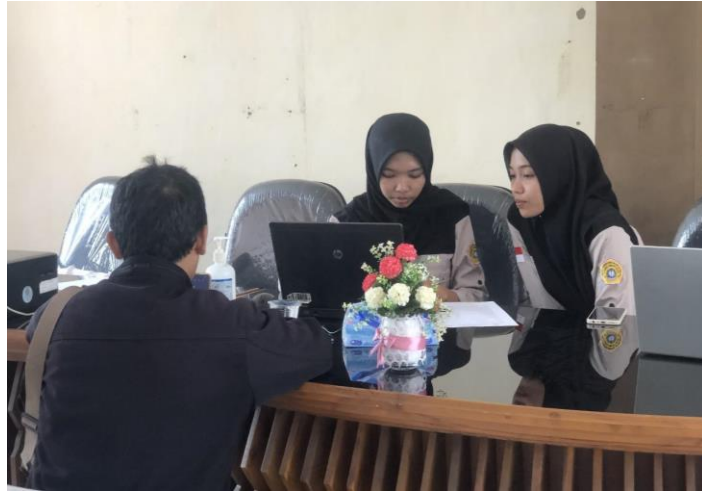
Gambar 3. Pendampingan SPT tahunan Dinas Koperasi.