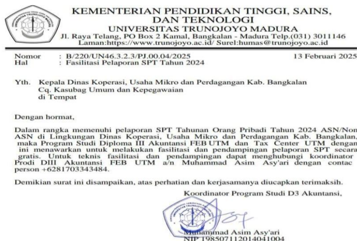
Gambar 2. Surat Permohonan Fasilitasi dan Pendampingan Pelaporan SPT Tahunan

Program pendampingan pelaporan SPT Tahunan Orang Pribadi yang dilaksanakan oleh relawan pajak merupakan salah satu upaya konkrit dalam mendukung peningkatan kepatuhan pajak masyarakat, khususnya di Kabupaten Bangkalan. Dilaksanakan dalam rangka mewujudkan pengabdian kepada negara, dalam hal ini guna membantu kelancaran proses pelaporan SPT Tahunan pajak agar tercapai penyelenggaraan administrasi negara yang efisien, efektif, berintegritas dan berkeadilan serta untuk meningkatkan penerimaan negara yang berasal dari sektor pajak (Direktorat Jenderal Pajak, 2019).