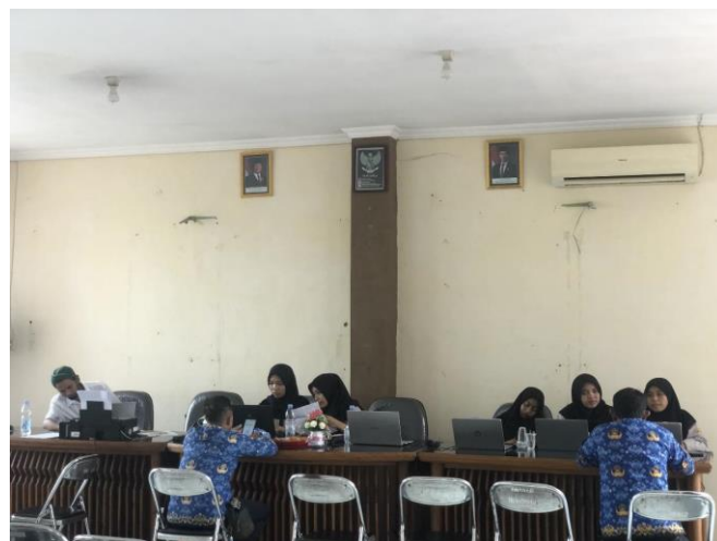
Gambar 4. Pendampingan SPT tahunan Dinas Koperasi.

Pendampingan di Dinas Koperasi, Usaha Mikro dan Perdagangan difokuskan pada pemberdayaan ASN serta pelaku UMKM binaan, mengingat masih rendahnya tingkat literasi perpajakan di kalangan tersebut (Widati dkk., 2025). Dalam pelaksanaannya, relawan pajak memberikan asistensi secara langsung melalui konsultasi, bimbingan teknis pengisian SPT, hingga pengunggahan data melalui sistem DJP Online. Para peserta juga berkesempatan untuk mengajukan pertanyaan langsung terkait permasalahan perpajakan yang dihadapi dalam menjalankan usaha (Direktorat Jenderal Pajak, 2025).