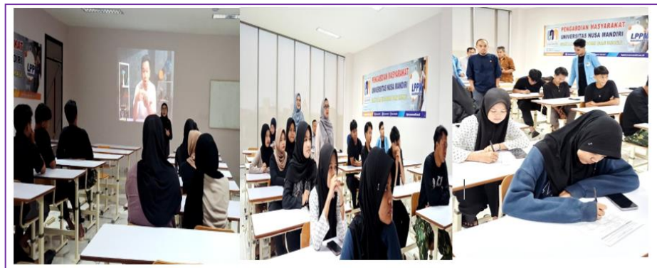
Gambar 2. Pelaksanaan Kegiatan Pelatihan Pengembangan Kapasitas Kewirausahaan Digital Melalui Pelatihan Media Sosial

Pelaksanaan kegiatan pelatihan pengembangan kapasitas kewirausahaan digital melalui pemanfaatan media sosial bagi anggota Badan Santunan Yatim di Kota Depok menunjukkan hasil yang positif dalam meningkatkan pemahaman serta keterampilan peserta dalam menggunakan media digital untuk mendukung kegiatan usaha. Kegiatan ini diikuti oleh pengurus dan anggota Badan Santunan Yatim yang memiliki minat untuk mengembangkan usaha mikro berbasis digital. Pelatihan dilaksanakan di Kampus Universitas Nusa Mandiri, Jatiwaringin, Jakarta Timur. Gambar 1 menunjukkan suasana pelaksanaan kegiatan pelatihan, sebagai berikut: