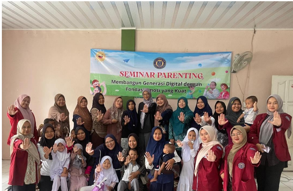
Gambar 1. Pelaksanaan Seminar Parenting

di rumah. Komitmen ini bertujuan agar orang tua dapat menerapkan ilmu yang diperoleh selama kegiatan parenting dalam kehidupan sehari-hari.