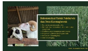
Gambar 6. Materi Penjelasan Sosialisasi Pendampingan POKDARWIS

Materi diatas adalah materi penjelasan yang digunakan pada sosialisasi pendampingan POKDARWIS dalam menggali potensi agrowisata di Desa Kawungluwuk, Subang. Dalam Power Point tersebut dipaparkan hasil observasi pada sektor pertanian, hortikultura, peternakan, dan budidaya sebagai potensi utama agrowisata di Desa Kawungluwuk. Potensi tersebut dapat dikembangkan menjadi berbagai kegiatan edukatif, seperti aktivitas bercocok tanam, petik hasil pertanian, interaksi dengan ternak, hingga pengenalan proses budidaya. Adapun segmentasi pasar yang dituju meliputi pelajar, komunitas, wisatawan kota, serta calon pelaku usaha yang tertarik pada pengalaman berbasis pertanian dan kehidupan pedesaan.