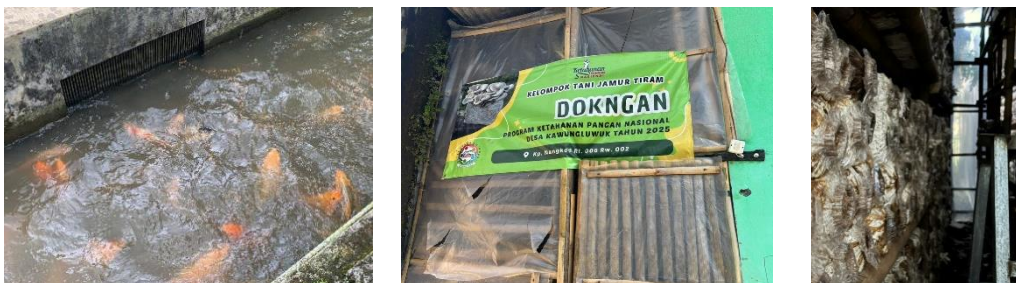
Gambar 5. Dokumentasi Kunjungan ke Budidaya Jamur dan Ikan Nila, Mas, Lele

Observasi pada kelompok budidaya dilakukan bersama Bapak Asep sebagai pengelola kelompok budidaya jamur tiram dan Bapak Sapei sebagai pengelola budidaya ikan mas, nila, dan lele. Kegiatan ini bertujuan untuk melihat potensi budidaya sebagai daya tarik wisata berbasis edukasi dan pengalaman. Berdasarkan hasil observasi, budidaya jamur tiram memiliki potensi sebagai wisata edukasi karena proses produkasinya yang unik, mulai dari penyusunan baglog hingga proses panen. Kegiatan ini dapat memberikan pengalaman langsung kepada wisatawan mengenai teknik budidaya jamur secara sederhana dan menarik. Sementara itu, budidaya ikan mas, nila, dan lele juga memiliki potensi untuk dikembangkan sebagai wisata berbasis aktivitas, seperti memberi pakan ikan dan edukasi mengenai proses pembesaran ikan. Keberadaan kolam budidaya yang terintegrasi dengan lingkungan pedesaan memberikan suasana alami yang mendukung pengembangan wisata. Dengan adanya berbagai jenis budidaya ini, Desa Kawungluwuk, Subang, memiliki peluang untuk mengembangkan agrowisata yang variatif dan tidak hanya bergantung pada satu sektor saja, melainkan terintegrasi antara pertanian, peternakan, dan budidaya.