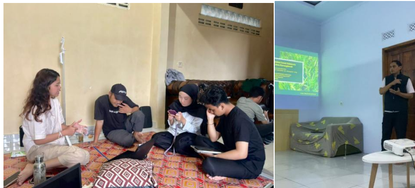
Gambar 7. Dokumentasi Kegiatan Sosialisasi Metode Mini Sharing Session

Pada bagian akhir sosialisasi, disampaikan rekomendasi kepada POKDARWIS yang menekankan pada pentingnya pemberdayaan masyarakat lokal sebagai aktor utama, mengingat sebagian besar potensi berada pada lahan milik pribadi. Oleh karena itu, diperlukan peningkatan komunikasi, pelatihan, serta pengemasan produk wisata, promosi, dan penumbuhan rasa memiliki untuk mendukung pengembangan agrowisata berbasis masyarakat.