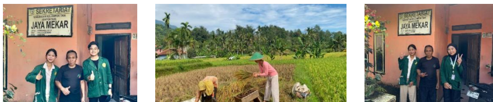
Gambar 3. Dokumentasi Kunjungan ke Gabungan Kelompok Tani & Kunjungan ke Lahan Sawah