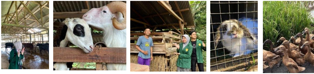
Gambar 4. Dokumentasi Kunjungan ke Ternak Sapi, Domba, Kelinci, & Itik