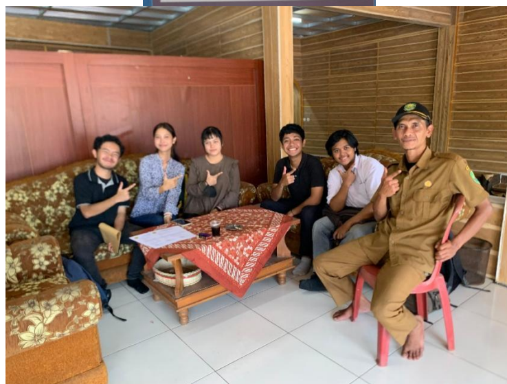
Gambar 2. Dokumentasi Media Informasi Sekunder & Dokumentasi Survey