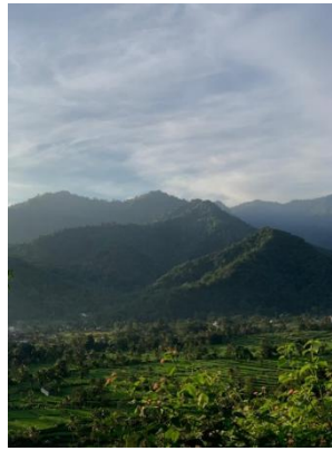
Gambar 1. Lanskap Alam Desa Kawungluwuk