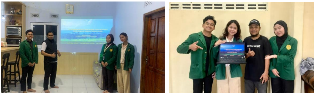
Gambar 8. Dokumentasi Kegiatan Sosialisasi Pendampingan POKDARWIS

Meskipun demikian, perwakilan POKDARWIS menyambut baik ide dan rekomendasi yang disampaikan. Hasil observasi dan pemetaan potensi yang dilakukan oleh penulis dinilai dapat menjadi referensi awal dalam upaya menggali dan mengembangkan potensi agrowisata di Desa Kawungluwuk. Dengan demikian, kegiatan Mini Sharing Session ini tidak hanya berfungsi sebagai sarana penyampaian informasi, tetapi juga sebagai ruang dialog yang membuka peluang kolaborasi dalam pengembangan wisata berbasis potensi lokal.