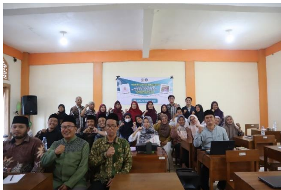
Gambar 6. Peserta Pelatihan Public Speaking dan Tim Pengabdian