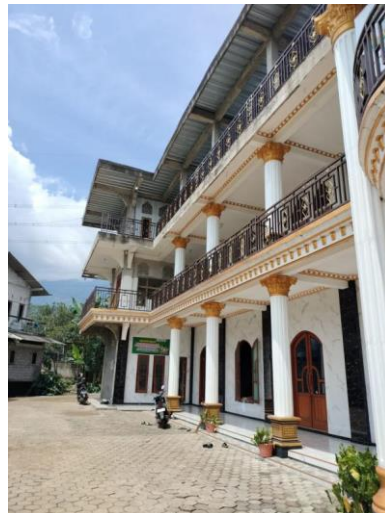
Gambar 1. Gedung sekolah SMP Islam Nihadul Qulub Ungaran

Ada mitos yang berkembang di masyarakat bahwa kemampuan berbicara didepan umum muncul karena bakat. Mitos tersebut nyatanya keliru. Faktanya, kemampuan berbicara didepan umum berkembang dengan latihan praktik (Rahmayanti S., Asbari M., Fadilah S., 2024). Pelatihan yang diminta adalah pelatihan akuntansi dan public speaking. Untuk pemula guna menaikkan branding dari guru-guru sekolah, perlu dilaksanakan pelatihan Public Speaking dan media sosial. Oleh karena itu sangat urgent untuk dilakukan “Pelatihan Public Speaking dengan level nasional dan bertaraf internasional untuk meningkatkan branding sekolah.