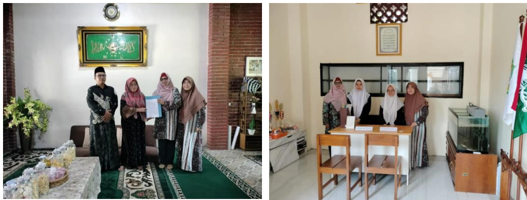
Gambar 3. MOU kesepakatan dengan mitra

Dalam usulan kegiatan pengabdian kepada masyarakat tahun ini (2025) telah disepakati bersama, bahwa permasalahan diprioritaskan dalam aspek sebagai berikut: (1) Bagaimana menerapkan teknik publik speaking bagi guru untuk pembelajaran KBM. (2) Bagaimana meningkatkan branding sekolah melalui video publik di Media sosial.