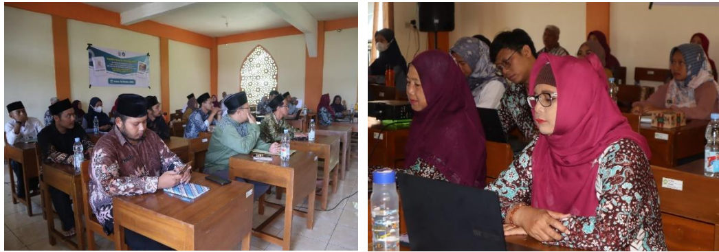
Gambar 4. Pemateri dan pelaksanaan acara pelatihan

Pelatihan Public Speaking Bagi Guru-Guru Untuk Pembelajaran KBM terdiri dari berbagai Jenis pidato berdasarkan tujuannya: (a) Pidato informatif, (b) Pidato rekreatif, (c) Pidato edukatif, (d) Pidato persuasive . Agar pembicaraan menarik memerlukan, maka dibutuhkan ekspresi suara, ekspresi mimik muka, dan dinamika berpidato.