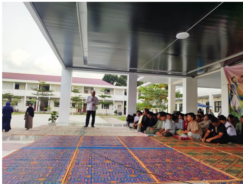
Gambar 2. Tim PKM menyampaikan materi

Kemudian, metode pelaksanaan ini diperkuat dengan sesi dialog partisipatif yang berfungsi sebagai sarana komunikasi dua arah antara pemateri dan audiens. Sesi ini menjadi ruang aman bagi para siswa untuk merefleksikan dilema sosial serta tekanan psikologis yang mereka rasakan, termasuk fenomena Fear of Missing Out (FOMO) dan rasa rendah diri yang dipicu oleh standar kemewahan di internet. Pemateri dalam hal ini bertindak sebagai fasilitator yang mengarahkan diskusi menuju pemahaman tentang batasan tegas antara berbagi inspirasi yang positif dengan perilaku riya' yang dapat merusak pahala ibadah. Dengan mengutamakan interaksi yang dinamis, kegiatan ini tidak hanya sekadar menyampaikan materi formal, tetapi juga mengupayakan internalisasi nilai-nilai kesederhanaan dan ketulusan hati. Harapannya, melalui pendekatan yang menyentuh sisi psikologis dan spiritual ini, Generasi Z dapat mengembalikan orientasi Idulfitri pada kesucian silaturahmi dan menjaga kesakralan hari kemenangan dari noda kesombongan materialistik.