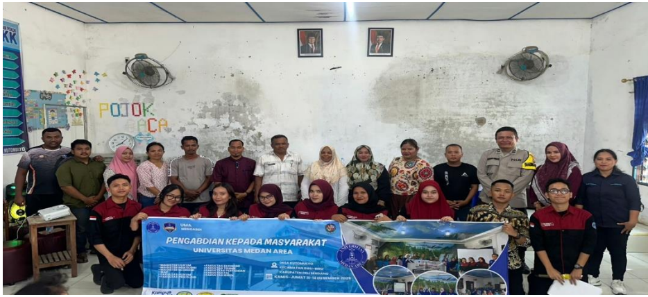
Gambar 5. Foto Bersama Dosen Kegiatan PKM dengan Perangkat Desa Kutumulyo

Tindak pidana penggelapan harta warisan, masuk kepada tindak pidana Penggelapan dalam KUHP Lama dalam keluarga pada pasal 376 “ketentuan dalam pasal 376 berlaku bagi kejahatan yang diterangkan dalam bab ini”. Jenis-jenis tindak pidana dalam keluarga antara lain: