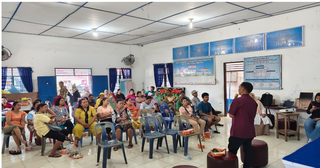
Gambar 2. Tim PKM memberikan edukasi

Pada hari kedua, peserta diberikan edukasi lebih mendalam melalui pendekatan praktis. Materi yang disampaikan mencakup cara mengenali mengenali tindak pidana penggelapan harta warisan dan strategi pencegahan, serta langkah-langkah awal yang harus dilakukan jika menemukan atau mengalami kasus tersebut. Selain itu, dilakukan simulasi penanganan awal kasus pembagian harta warisan dan tindak pidananya. Simulasi ini melibatkan peserta untuk berperan aktif agar memiliki keterampilan praktis dalam mendeteksi, merespon dan menyampaikan kasus harta warisan yang tidak mau di bagi ahli waris yang lain Di akhir hari kedua, dilakukan evaluasi kegiatan melalui penyebaran kuesioner dan sesi refleksi bersama. Peserta diminta memberikan umpan balik mengenai pemahaman yang diperoleh, kebermanfaatan materi, serta saran untuk pengembangan kegiatan serupa ke depan. Evaluasi ini menjadi tolok ukur keberhasilan pelaksanaan workshop dan dasar perencanaan tindak lanjut program pencegahan tindak pidana pembagian harta warisan di Desa Kutomulyo.