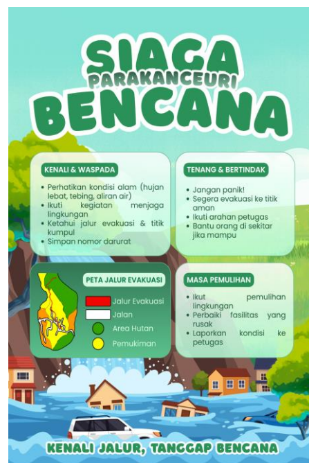
Gambar 5. Poster edukasi bencana longsor dan banjir bandang di titik rawan lokasi wisata 2.