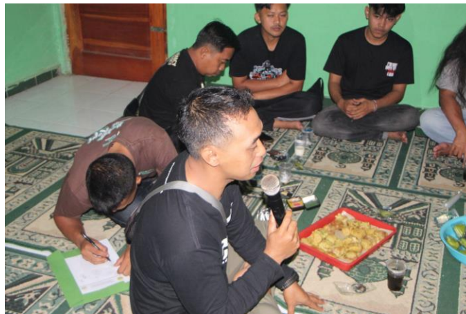
Gambar 3. Proses penyusunan draf Standard Operating Procedure (SOP) mitigasi bencana bersama masyarakat.