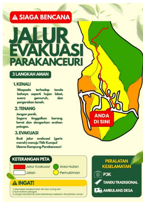
Gambar 4. Poster edukasi bencana longsor dan banjir bandang di titik rawan lokasi wisata 1.