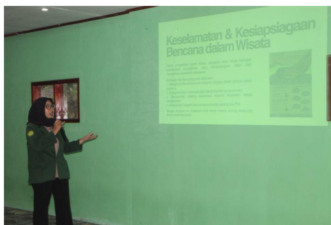
Gambar 2. Diskusi awal dan pemetaan masalah bersama pengurus Pokdarwis Kampung Parakanceuri.

Oleh karena itu, penguatan kapasitas SDM di masa depan tidak dapat hanya berhenti pada penyediaan atribut keamanan fisik semata. Sangat disarankan agar program selanjutnya mulai menyentuh aspek profesionalisme melalui formalisasi kerja sama dengan pihak ketiga, seperti perusahaan asuransi dan lembaga sertifikasi profesi (Maharani, 2022). Langkah ini penting untuk menjamin standar keselamatan destinasi yang tidak hanya kuat secara teknis di lapangan, tetapi juga memiliki legitimasi hukum dan perlindungan ekonomi yang berkelanjutan. Transformasi dari pola pikir reaktif menuju proaktif-profesional akan menjadi kunci utama dalam mewujudkan Desa Wisata Kampung Parakanceuri sebagai destinasi yang tangguh ( resilient ).