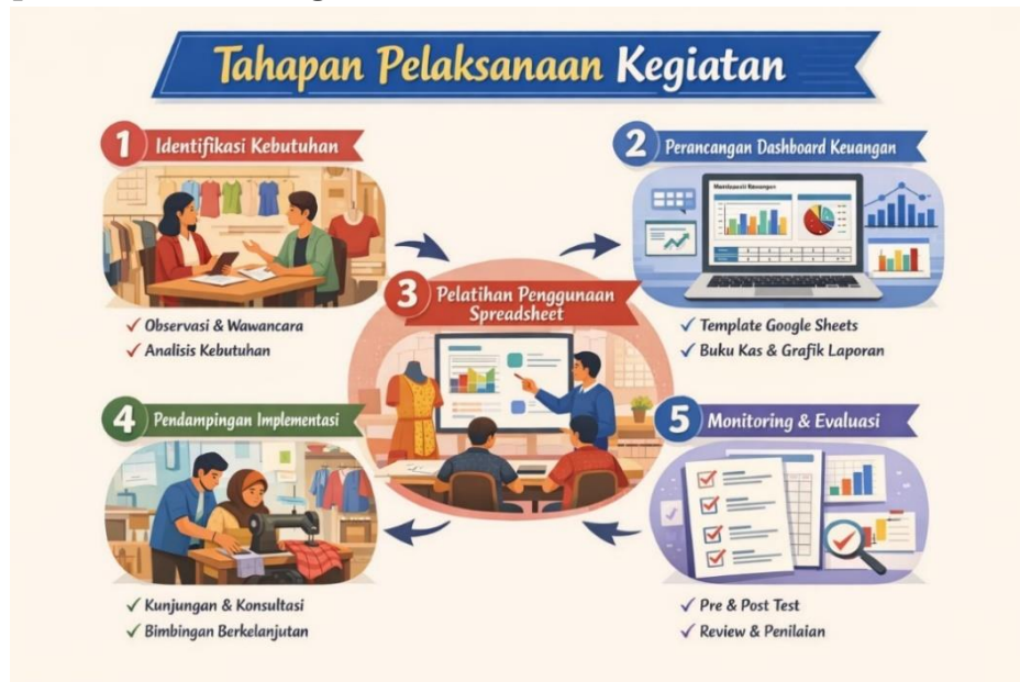
Gambar 1. Tahapan Pelaksanaan

Pelaksanaan kegiatan pengabdian ini dibagi menjadi lima tahap yang saling berkaitan dan dilakukan secara sistematis. Berikut uraian masing-masing tahap: