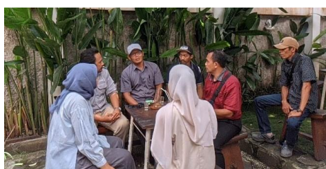
Gambar 3. Pembentukan Tim Digital Kreatif

Indikator capaian dari kegiatan ini adalah Struktur kelembagaan BUMDes mencakup unit usaha wisata dan tim digital aktif dengan target luaran yang berhasil terpenuhi yaitu Struktur organisasi BUMDes diperbarui dan memiliki divisi wisata untuk memperkuat pengelolaan wisata di Desa Tambaknegara dengan melibatkan masyarakat sekitar (Wijaya et al., 2023).