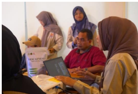
Gambar 2. Pelatihan Konten Digital

konten promosi secara berkala diupdate oleh admin dengan tujuan mengenalkan wisata ke masyarakat yang lebih luas dan mampu bersaing dengan wisata lainnya di Kabupaten Banyumas (Wijaya et al., 2023).