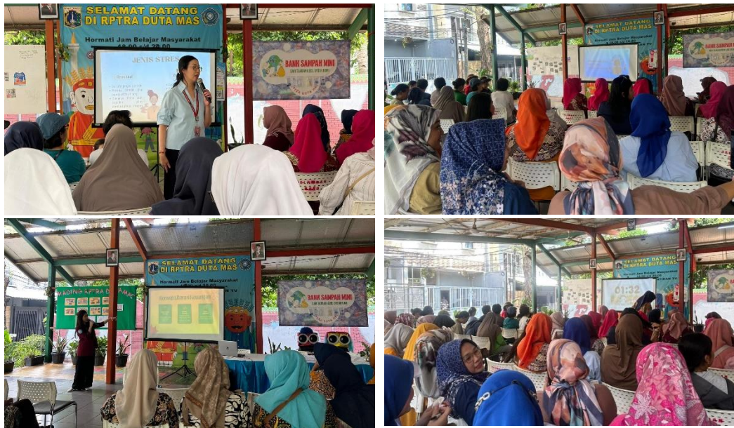
Gambar 2. Psikoedukasi oleh Tim PKM dan Dosen