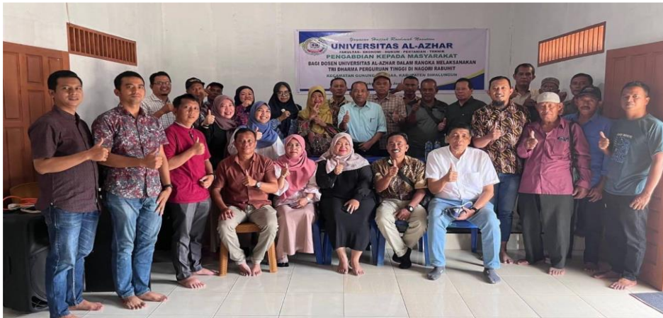
Gambar 5. Foto bersama PKM dan peserta