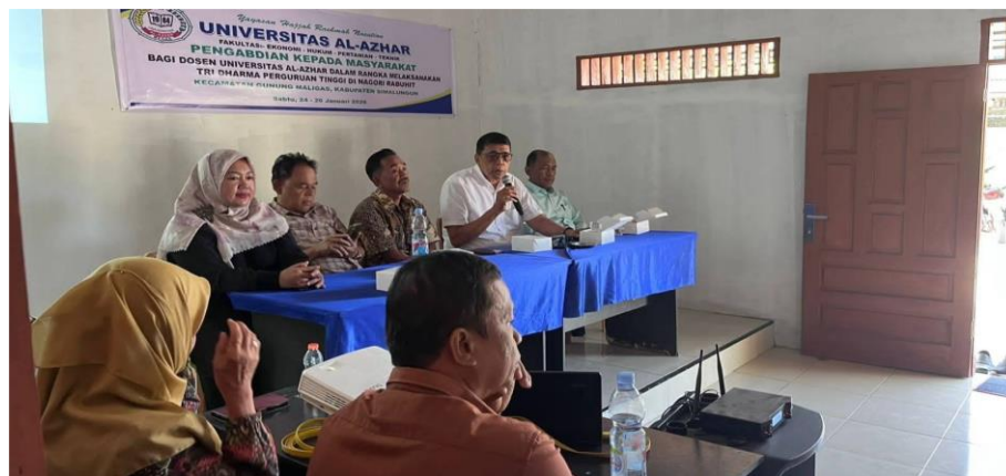
Gambar 1. Penyampaian materi TIM PKM

Kegiatan pengabdian kepada masyarakat dengan judul “Sosialisasi Hukum tentang isiko dan Dampak Penyalahgunaan serta Peredaran Narkotika bagi Generasi Muda di Nagori buhit, Kecamatan Gunung Maligas, Kabupaten Simalungun” telah dilaksanakan dengan melibatkan 28 peserta yang berasal dari kalangan generasi muda di Nagori Rabuhit. Kegiatan ini bertujuan untuk meningkatkan pemahaman hukum peserta mengenai bahaya penyalahgunaan narkotika, risiko keterlibatan dalam peredaran gelap narkotika, serta dampak sosial, kesehatan, pendidikan, dan hukum yang dapat ditimbulkan. Penggunaan narkotika juga dapat memicu tindak kekerasan, perilaku agresif, dan mengganggu kemampuan individu untuk menilai situasi dengan jernih, bahkan dapat menyebabkan gangguan mental (Dwi, et al 2023). Contoh narkotika yang umum termasuk kokain, sabu, ecstasy, dan lain-lain karena itu. Pendidikan yang tepat dapat membantu mengubah perilaku dan pola pikir mereka, sekaligus memberikan bimbingan agar anak-anak dapat tumbuh dan berkembang dengan baik. Dengan pemahaman yang mendalam, mereka akan lebih mampu membuat keputusan yang sehat dan positif di masa depan (latifatul, 2023).