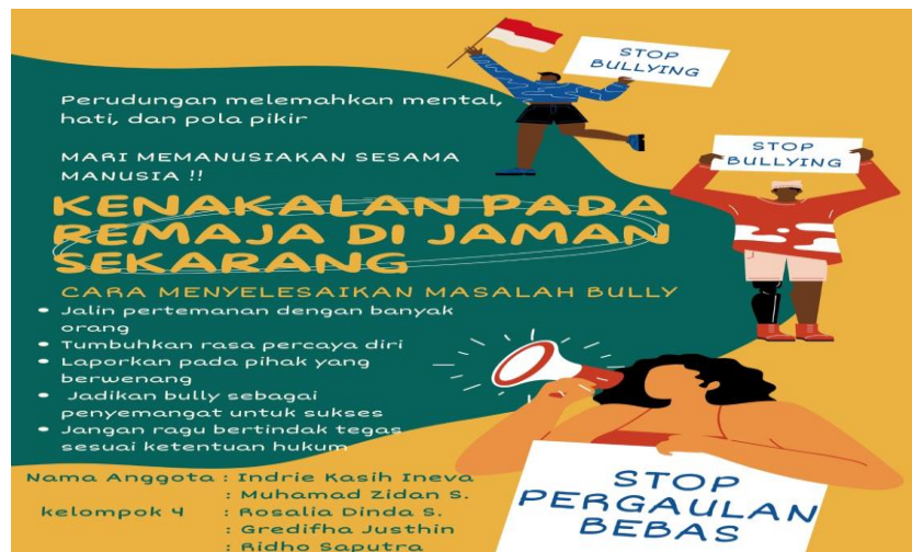
Gambar 5. Poster yang dibuat oleh kelompok 4 (empat)

Kelompok 4 (empat), mereka mengatakan kenakalan pada remaja di jaman sekarang sangat memperhatikan, dimana masih banyak remaja yang suka membully atau mengejek-ejek temannya sendiri. Sebagaimana poster yang dibuat oleh kelompok 4, mereka memberikan tips cara menyelesaikan masalah bully sebagai berikut jalin pertemanan dengan banyak orang, tumbuhkan rasa percaya diri, laporkan pada pihak yang berwenang, jadikan Bully sebagai penyemangat untuk sukses, jangan ragu bertindak tegas sesuai ketentuan hukum.