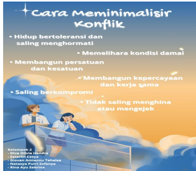
Gambar 3. Poster yang dibuat oleh kelompok 2 (dua)

Kelompok 2 (dua) menyatakan didalam poster yang telah dibuatnya, dimana mereka mengatakan agar terhindar dari konflik yaitu tidak saling menghina atau mengejek, membangun kepercayaan dan kerja sama, membangun persatuan dan kesatuan, hidup bertoleransi dan saling menghormati, memelihara kondisi damai dan saling berkompromi.