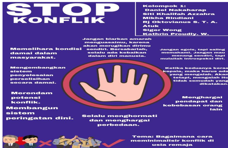
Gambar 2. Poster yang dibuat oleh kelompok 1 (satu)

Pada tanggal 25 Juli 2024 dilaksankannya P5, Adapun hasil yang dibuat oleh siswa siswi sebagai berikut kelompok 1 (satu) membuat poster dengan tema “Bagaimana cara meminimalisir konflik diusia remaja” dimana didalam poster tersebut menyebutkan cara mencegah konflik, salah satunya yaitu selalu menghormati dan menghargai perbedaan.