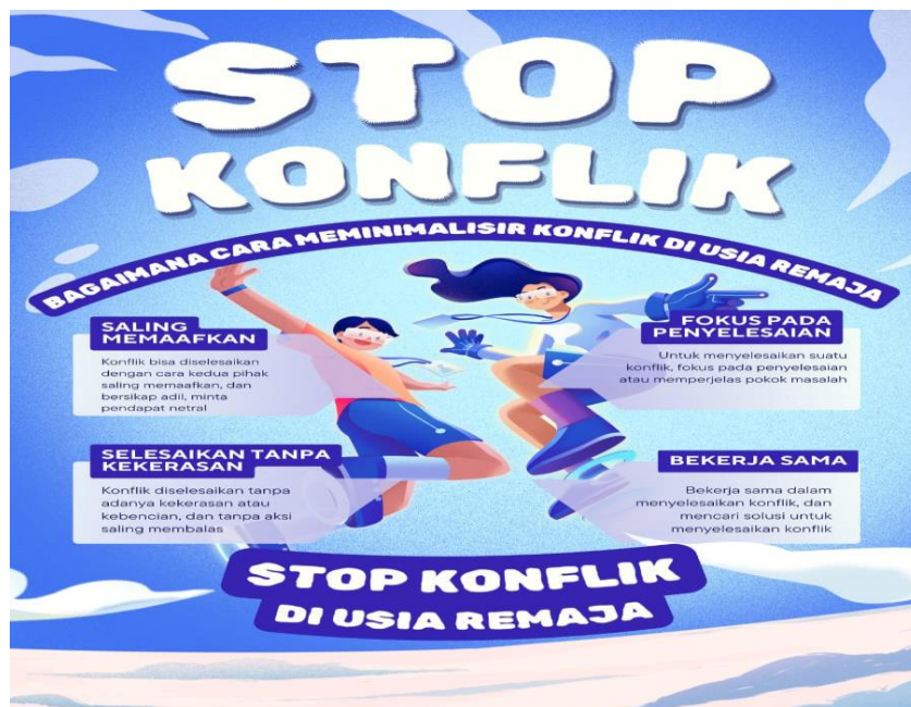
Gambar 4. Poster yang dibuat oleh kelompok 3 (tiga)

Kelompok 3 (tiga) menyatakan bahwa cara agar tidak terjadi permasalahan/konflik yaitu: Pertama, konflik bisa diselesaikan dengan cara kedua pihak saling memaafkan dan bersikap adil. Kedua, untuk menyelesaikan suatu konflik, harus fokus pada penyelesaian atau memperjelas pokok masalah. Ketiga, konflik diselesaikan tanpa adanya kekerasan atau kebencian dan tanpa aksi saling membalas. Keempat, harus bekerja sama dalam menyelesaikan konflik dan mencari solusi untuk menyelesaikan konflik.