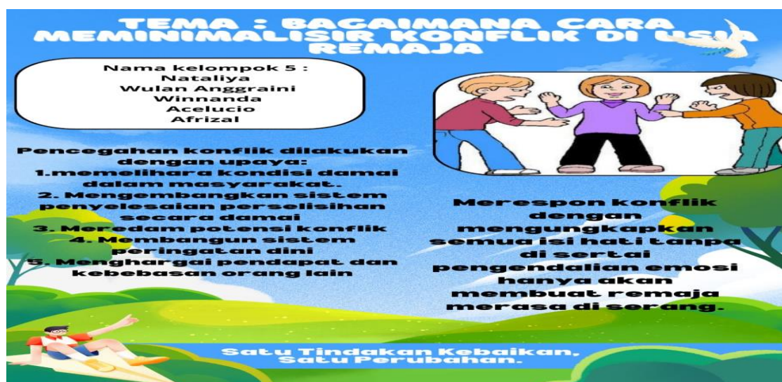
Gambar 6. Poster yang dibuat oleh kelompok 5 (lima)

Kelompok 5, mengatakan jika setiap orang yang mempunyai permasalahan ataupun konflik. Maka mereka harus merespon konflik tersebut dengan mengungkapkan semua isi hati tanpa disertai emosi. Adapun cara pencegahan konflik dilakukan dengan upaya sebagai berikut memelihara kondisi damai dalam Masyarakat, mengembangkan system penyelesaian perselisihan secara damai, meredam potensi konflik, membangun system peringatan dini, menghargai pendapat dan kebebasan orang lain.