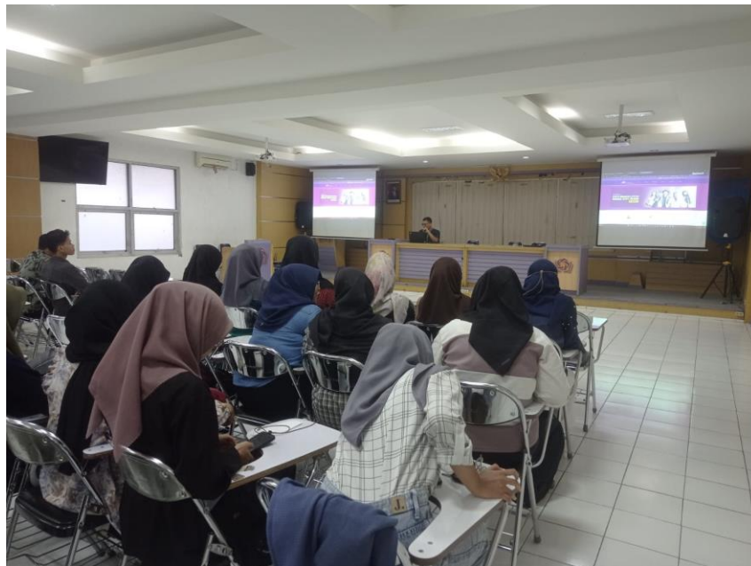
Gambar 2. Peserta Kegiatan Pelatihan

Pada tahap akhir pelaksanaan dilakukan post-test yang bertujuan mengukur pemahaman para peserta setelah narasumber memberikan paparan materi dan tanya jawab. Pertanyaan yang digunakan masih sama dengan pertanyaan Pre-test namun urutan soal diacak sedemikian rupa. Selain itu tim pelaksana juga mendapatkan umpan balik dan menilai seberapa efektif kegiatan ini berjalan. Berdasarkan hasil uji akhir didapati rata-rata 61,47 dari 100. Nilai perseorangan terendah ada pada nilai 30 dari 100 dan nilai tertinggi perseorangan ada pada nilai 100 dari 100. Berdasarkan data tersebut terdapat peningkatan pengetahuan rata-rata sebesar 79% dari keadaan sebelum pelaksanaan kegiatan