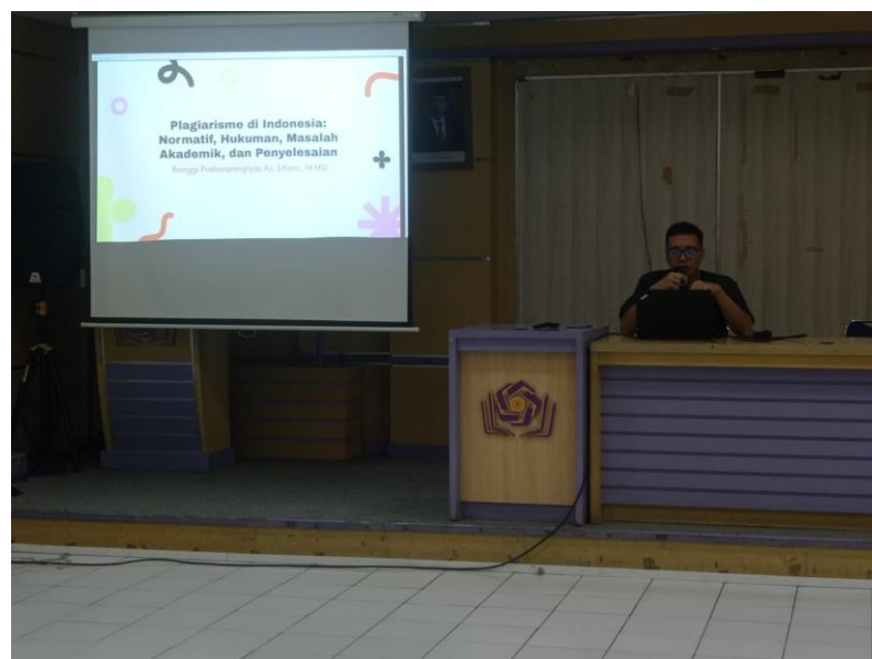
Gambar 1. Penyampaian Materi oleh Narasumber

Selain itu penting bagi institusi pendidikan untuk memberikan edukasi yang memadai tentang plagiarisme dan cara menghindarinya, serta meningkatkan pengawasan dan memberikan sanksi yang tegas untuk mencegahnya. Selain itu dijelaskan juga bagaimana mengatasi kecenderungan plagiarisme pada mahasiswa, ada beberapa langkah yang bisa diambil dengan menerapkan langkah-langkah ini, diharapkan mahasiswa dapat mengembangkan keterampilan menulis yang baik dan menghindari praktik plagiarisme.