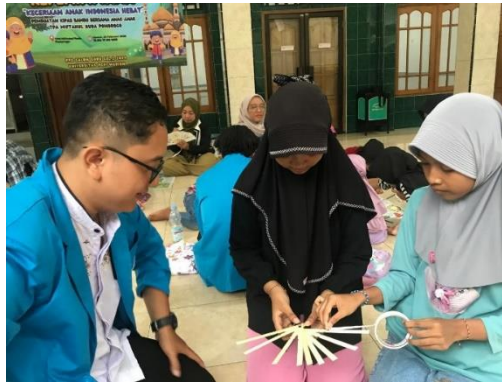
Gambar 4. Proses Perakitan Kerangka dengan Kain Belacu: Penempelan Double tape

Bahan perekat yang umum digunakan dalam pembuatan seni kriya ada tiga, yakni lem kayu putih, double tape , dan lem serba guna. Masing-masing perekat memiliki kegunaan masing-masing. Lem kayu putih biasa digunakan pada objek-objek yang membutuhkan ketahanan. Double tape digunakan pada objek yang ringan, sementara lem serba guna digunakan pada benda-benda yang memiliki volume seperti botol, kardus bekas, kaleng bekas dan lain sebagainya (Naradika & Raindriati, 2023)