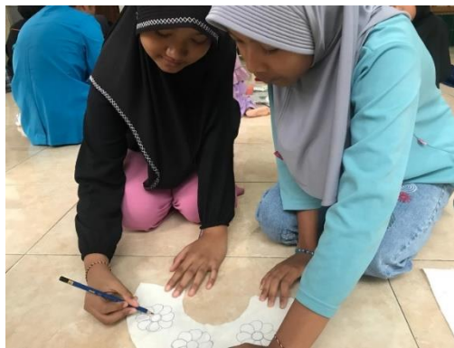
Gambar 3. Proses Pembuatan Pola pada Kain Belacu

Kreativitas sangat penting untuk dikembangkan, hal ini karena kreativitas memegang pengaruh penting dalam kehidupan seseorang. Maka dari itu, kreativitas perlu dikembangkan sejak dini. Kreativitas merupakan kemampuan seorang yang dalam kehidupan sehari-hari dikaitkan dengan prestasi yang istimewa dalam menciptakan hal-hal baru atau sesuatu yang sudah ada menjadi konsep baru (Fakhriyani, 2016). Kegiatan inilah yang menjadi salah satu alasan bahwa kegiatan ini dapat mengembangkan daya kreativitas, daya cipta, dan daya pikir sesuai dengan imajinasi.