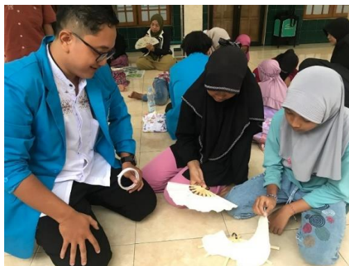
Gambar 5. Proses Perakitan Kerangka dengan Kain Belacu: Penempelan Kain Belacu pada Kerangka

Proses perakitan kerangka dengan kain belacu menggunakan double tape dapat dilakukan seperti pada proses pembuatan seni kriya lainnya. Adapun langkah-langkah penggunaan double tape sebagai alternative untuk merekatkan dua sisi objek adalah sebagai berikut. Pertama, anak-anak memotong double tape dengan menyobek langsung. Langkah ini dilakukan karena penggunaan gunting dapat membuat double tape menempel pada gunting dan bekas rekatannya sulit dihilangkan. Kedua, menempelkan potongan double tape pada kerangka kipas. Ketiga, setelah menempel sempurna, bagian kertas licin yang ada pada double tape diangkat. Keempat, menempelkan kain berpola pada kerangka.