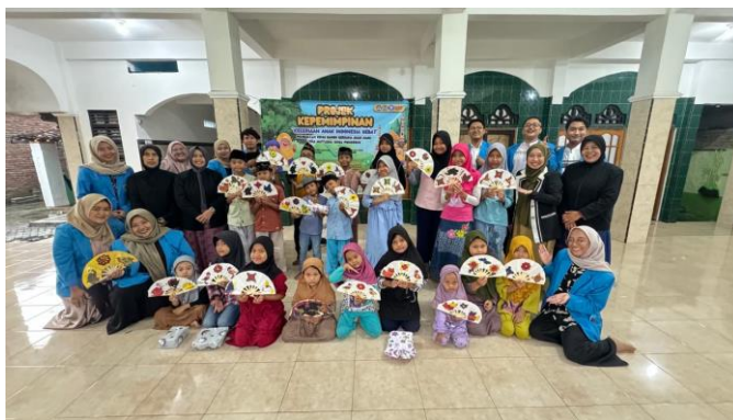
Gambar 8. Sesi Foto Bersama

Di lain sisi, anak-anak madrasah diniyah juga memberikan atensi dan antusiasme yang tinggi hingga akhir kegiatan. Melalui kegiatan wawancara, diketahui bahwa mereka menunjukkan ketertarikan pada kegiatan karena sejumlah alasan. Di antaranya ialah 1) penggunaan cat aklirik adalah hal baru yang belum pernah mereka gunakan sebelumnya, 2) perasaan gembira karena bisa mengekspresikan diri melalui kegiatan mencampurkan warna primer (dasar) menjadi warna sekunder, 3) perasaan gembira karena mendapatkan kipas yang telah dihiasnya sendiri.