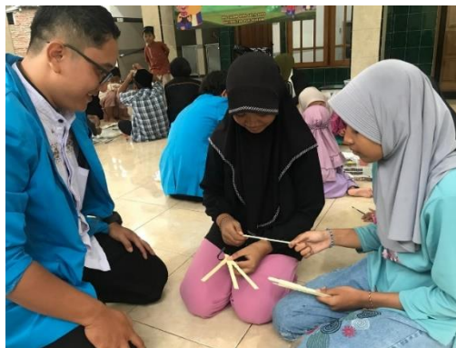
Gambar 2. Proses Pembuatan kerangka Kipas dari Bambu

Adapun konsentrasi dan perhatian penuh ketika merangkai stik bambu pada saat proses pembuatan kerangka bertujuan untuk 1) memastikan perangkaian stik rapi, 2) memastikan ukuran stik bambu yang dirangkai sama, 3) memastikan stik yang digunakan cukup kuat supaya tidak mudah rusak, dan 4) menghindari telusupen (Jw: cedera karena serat bambu menusuk kulit) pada anak-anak. Untuk itulah, pendampingan mahasiswa sebagai instruktur menjadi tindakan penting yang tidak boleh dilewatkan.