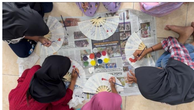
Gambar 7. Proses Penghiasan Kipas dengan Lukis Aklirik

Adapun warna yang disediakan dalam kegiatan pendampingan pembuatan kipas lukis ini adalah warna dasar. Sehingga untuk membuat ragam warna lainnya perlu mengombinasikan warna-warna tersebut lebih dahulu. Setelah itu, anak-anak memberikan warna pada pola yang telah dibuat. Langkah-langkah ini sesuai dengan teknik menggunakan cat aklirik dalam pembelajaran seni rupa. Adapun langkah menggunakan cat aklirik adalah sebagai berikut 1) sebelum menggunakan aklirik, kuas dibasahi dengan air, 2) cat aklirik dicampurkan di palet untuk memperoleh warna yang diinginkan, 3) penggunaan kuas disesuaikan dengan area dan detail yang ingin dilukis, serta 4) mulai dengan warna-warna dasar kemudian gunakan kuas yang lebih kecil untuk menambahkan tekstur dan detail (Naradika & Raindriati, 2023).