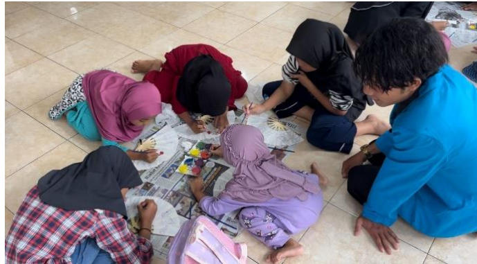
Gambar 6. Proses Penghiasan Kipas dengan Lukis Aklirik

keunggulan. Di antaranya ialah 1) mudah didapatkan di toko-toko alat lukis, 2) harganya sangat terjangkau, 3) cat mudah mengering terutama yang water base (Kusuma H. B., 2024).